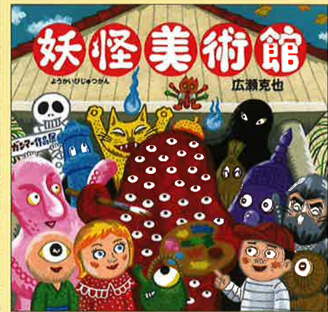
『妖怪美術館』2017 絵本館