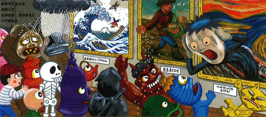
『妖怪美術館』2017 絵本館