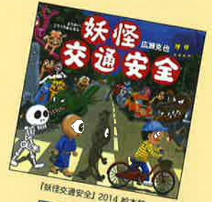
【妖怪交通安全】2014 絵本館