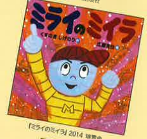
【ミライのミライ】2014 読書会