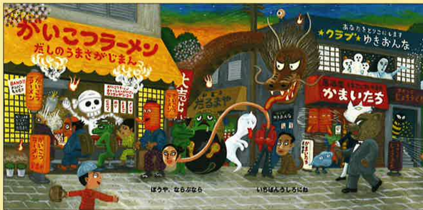
ぼうや、ならぶなら いちばんうしろにね