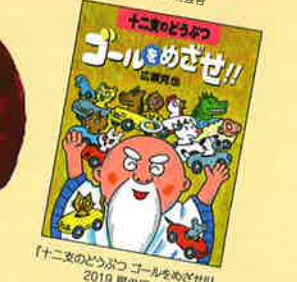
【十二歳のどうぶつ ゴールめざせ!!】2019 読書会