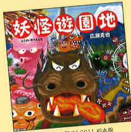
【妖怪遊園地】2011 絵本館