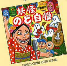
【妖怪のど自慢】2020 絵本館