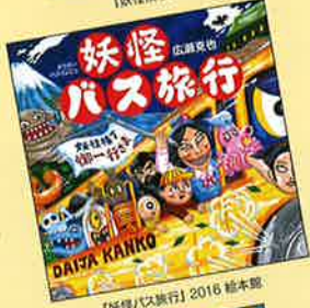
【妖怪バス旅行】2016 絵本館