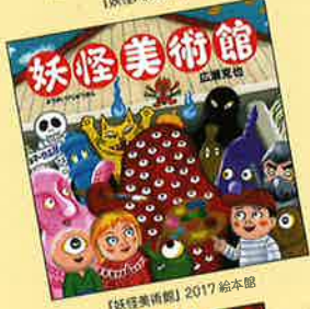
【妖怪美術館】2017 絵本館