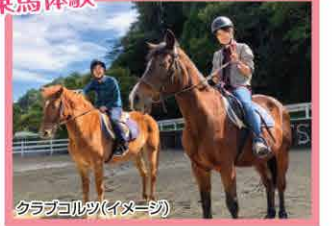
クラブホルク(イメージ)