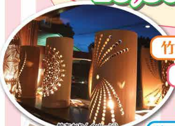
竹あかり(イメージ)