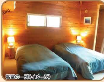
客室の一隅(イメージ)