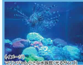
(イメージ) マリンジャム小さな水族館(光るサンゴ)