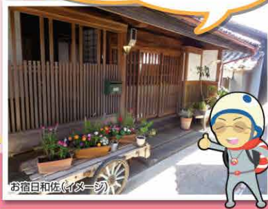
お宿日和佐(イメージ)