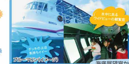
ブルーマリン(イメージ)