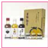
(株)黄金の村 「木頭ゆずベストセレクション」