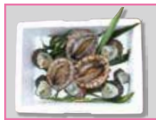
中徳 「アロビ&サザエバーベキューセット小」