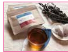
(株)トータス「あまべ藍茶&ルイボスティール」 かいふ菓子ロマンきもとや「波乗りバウムBIG WAVE」セット