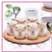
砂美かたやま 「チーズプリン・牛乳柚子プリンセット」

【特産品5種類のうち1つ/計25名様】 賞品は選択できません。主催者にて決定いたします。