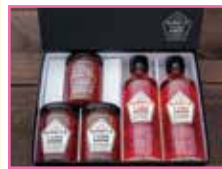
観光農園サニースファーム 「純苺ジャムとシロップセット」