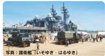
写真：護衛艦「いそゆき・はるゆき」

※諸事情により、日時等に変更がでる場合がございます。あらかじめ、ご了承ください。