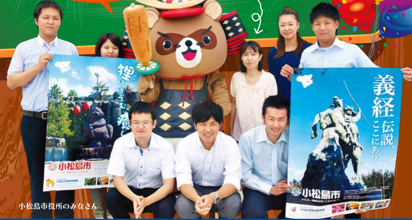
小松島市役所のみなさん