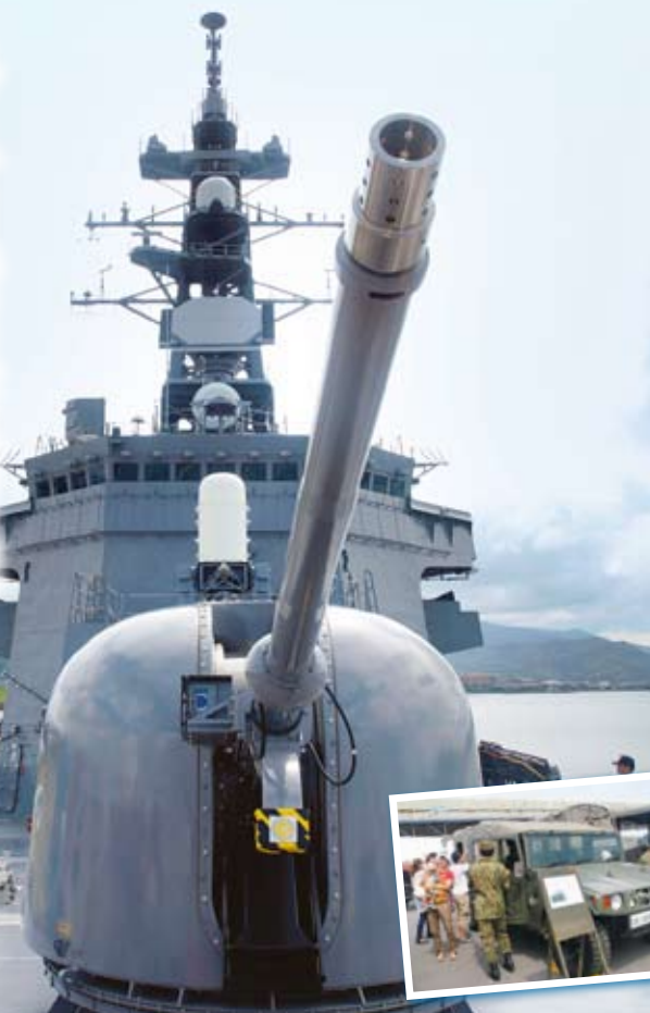
写真：護衛艦「いなづま」